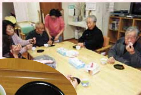
◀▲さくらもち みんなで美味しく いただきました