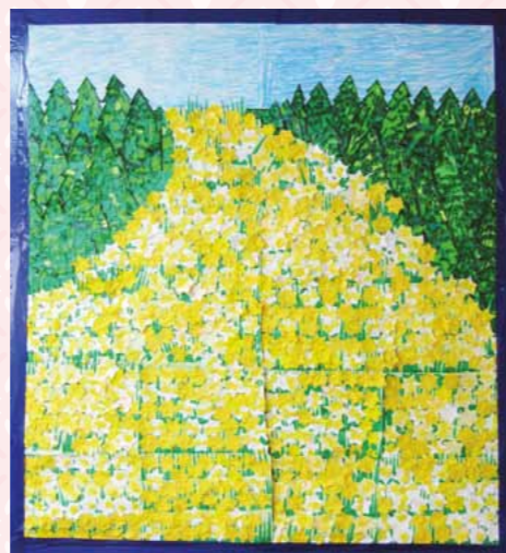
▲2月のオブジェ 水仙畑