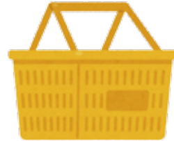
【カゴ(プラスチック)】～3日間