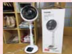
[サーキュレーター]