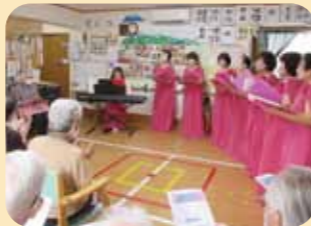
アップルハーモニー