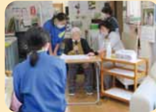
大河原中学校ボランティア