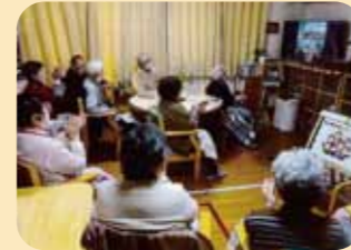
社協と大河原小学校 オンライン福祉教育